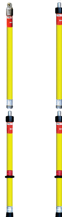
Ejemplo: Pértiga acoplable en dos tramos con acople universal. Cód.: HT-15B.H + HT-15P.U